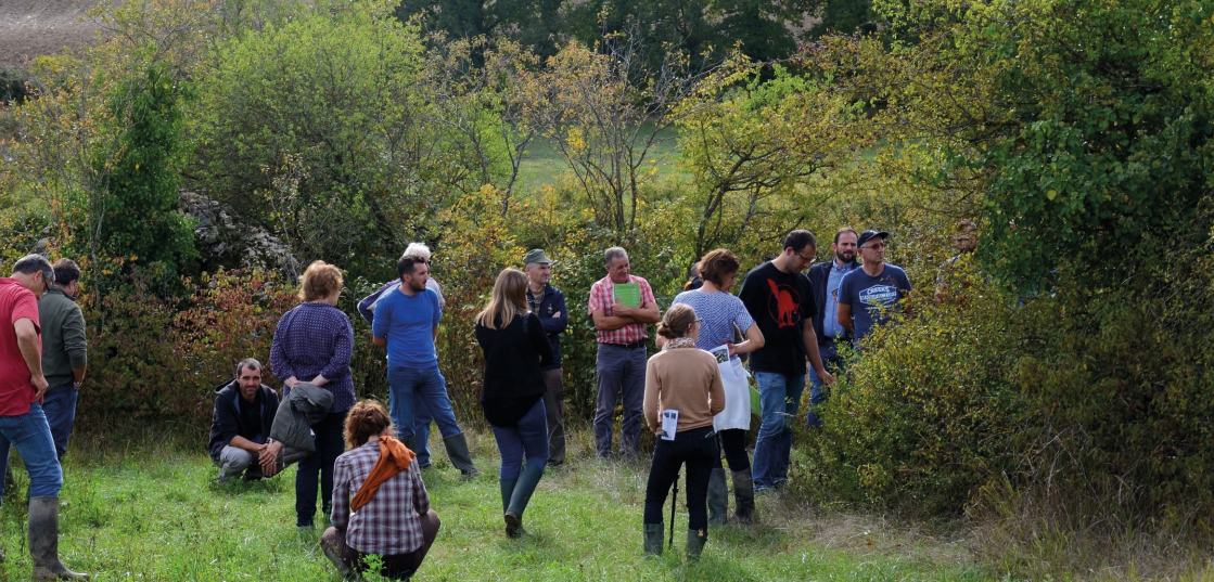
> Visite de ferme pilote dans le cadre du programme CORRIBIOR

« CORRIBIOR », « Messiflore » et le programme de « Conseils et accompagnement pour la mise en oeuvre de mesures en faveur de la biodiversité » sont trois programmes distincts, partageant une stratégie commune mise en oeuvre pour développer des modes de gestion favorables à la préservation ou à la restauration de la sous-trame milieux ouverts de la Trame Verte et Bleue et pour accompagner les acteurs du territoire.