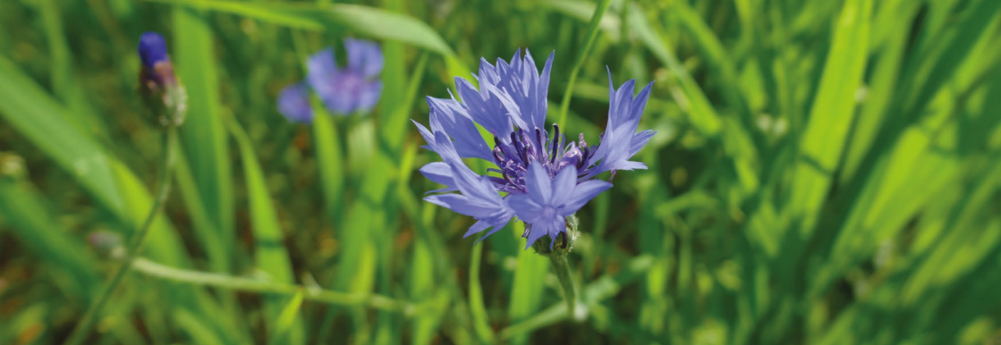
> Bleuet des champs ( Centaurea cyanus ) plante messicoles, très attractive pour les pollinisateurs.

La Fédération régionale des chasseurs d'Occitanie (FRCO), l'Association française pour l'Arbre et la Haie champêtre d'Occitanie (AFAHC Oc), Le Conservatoire botanique national des Pyrénées et de Midi-Pyrénées (CBNPMP), la Ligue pour la protection des oiseaux Aveyron (LPO 12), ont le plaisir de vous inviter à trois demi-journées de restitution de leurs programmes menés dans le cadre de la Trame Verte et Bleue, les :