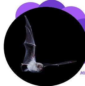
Minioptère de Schreibers

Ce gîte se fixe sur une façade . Bien ensoleillée à un minimum de 4m du sol . Fixez solidement le gîte pour qu'il ne bouge pas avec le vent. Lorsqu'il sera occupé les excréments des chauve-souris tomberont au sol. Vous pouvez fixer une planchette à une quarantaine de centimètres sous le gîte que vous nettoierez de temps en temps. Le plus simple est de choisir un mûr bordé par des végétaux qui bénéficieront de cet apport de très bon engrais .