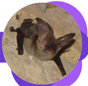
Oreillard gris

L'extérieur du gîte peut être peint avec une couleur sombre pour imperméabiliser et protéger le bois . Utilisez de la peinture non toxique.