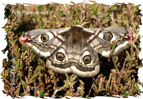
Petit Paon de nuit