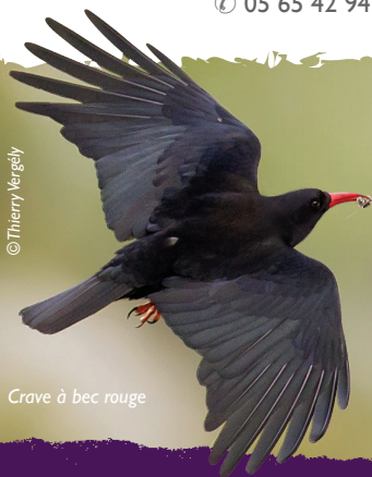
Crave à bec rouge