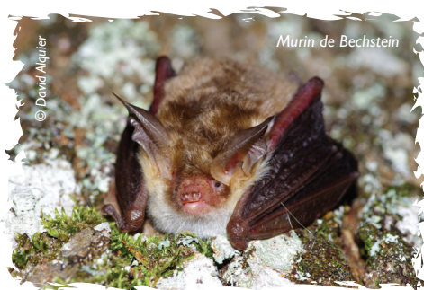
Murin de Bechstein