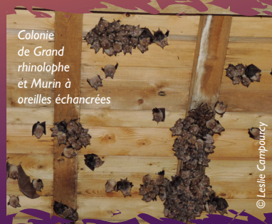
Colonie de Grand rhinolophe et Murin à oreilles échancrées

Chaque année au printemps, 300 femelles de Grand Rhinolophe et Murin à oreilles échancrées, deux espèces de chauves-souris protégées, prennent leur quartier dans les combles d'une église de la commune de Bozouls.