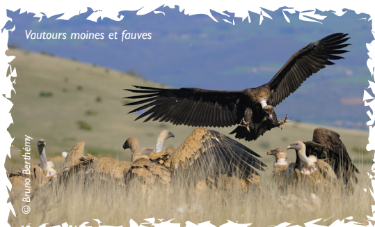
Vautours moines et fauves

> Cynthia Augé (LPO Grands causses) ☎ 07 76 11 40 27