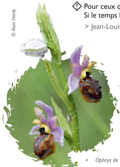
• Ophrys de l'Aveyron