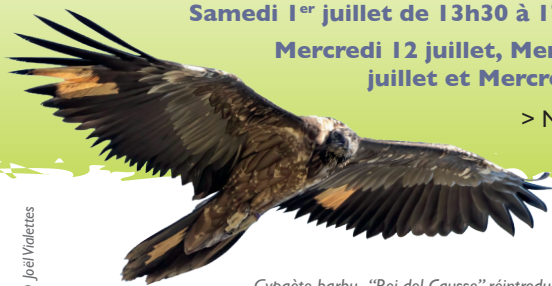
Gypaète barbu, "Rei del Causse" réintroduit en 2022